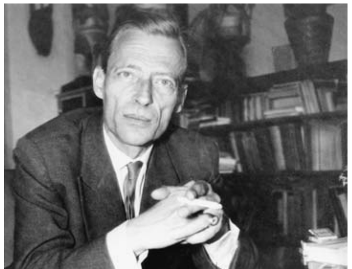
Jean Gebser in Hamburg, 1964/65.

Gebser's Werk ist auf die Zukunft bezogen, es macht in der Gegenwart auf die «Spuren» einer gemeinsamen, sinnvollen Zukunft aufmerksam. Gebser's Hauptwerk «Ursprung und Gegenwart» weist auf den Reichtum des menschlichen Bewusstseins hin. Gebser zeigt darin, dass unser Bewusstsein auf eine geheimnisvolle Weise mehrfach strukturiert ist. Bewusstsein ist nicht, wie wir oft meinen, mit verstandesmässigem Begreifen identisch. Für unser rationales Denken unfassbare Fähigkeiten und Bereiche: den magischen Weltbezug und die mythischen Weltdeutungen sind nach Gebser so gültig und wertvoll und vor allem so wirksam wie die begriff-