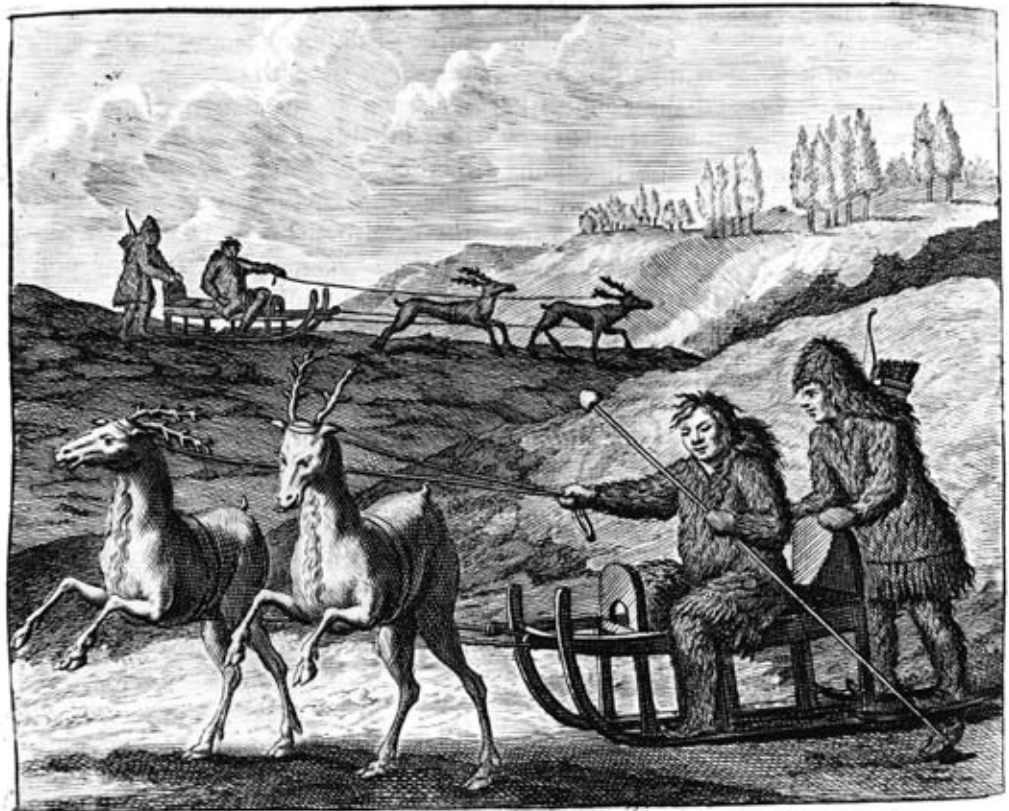
Samojedische Jäger (Kornelis Philander de Bruyn: Travels into Muscovy, London 1737).