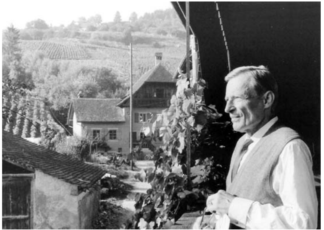
Jean Gebser in Môtier, 1972.

wichtiger als das Resultat, die Zeit wichtiger als der «ding-feste» Raum. Für Gebser ist der «Einbruch der Zeit», das heisst das Bewusstwerden dessen, was Zeit ist, der Grund dafür, dass der fixierte Standpunkt, der die Orientierung im dreidimensionalen Raum ermöglicht hat, relativiert wird.