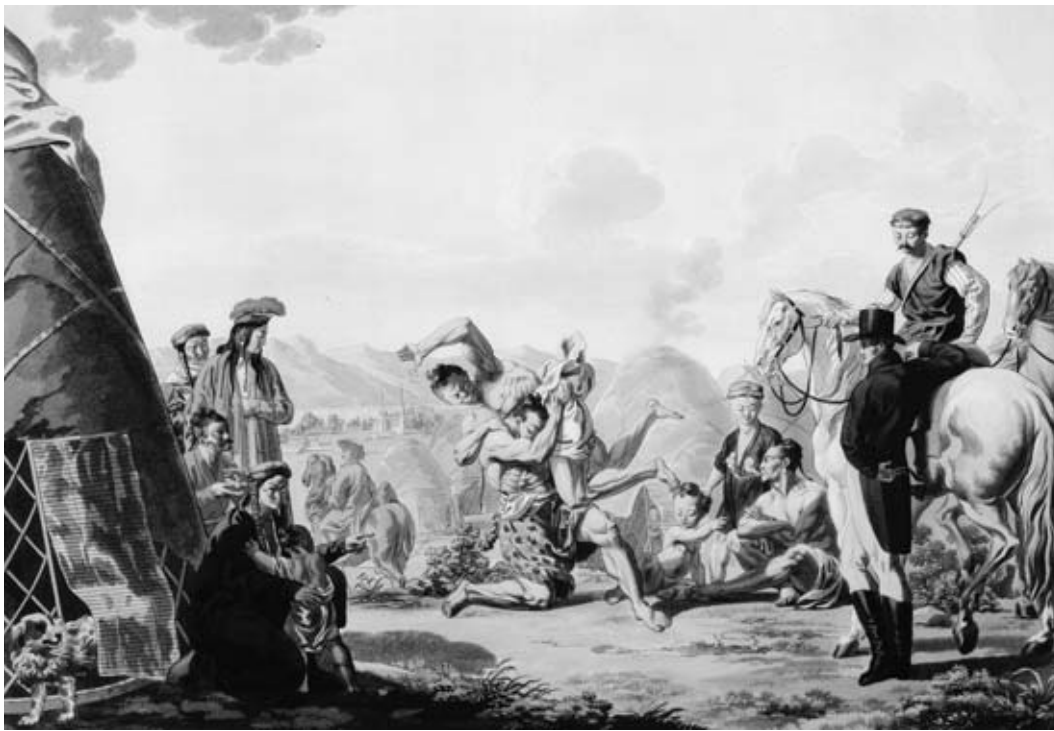
Eine vornehm gekleidete Frau aus Kaluga, südwestlich von Moskau (Johann Gottlieb Georgi: Descriptions de toutes les nations de l'Empire de Russie , St. Petersburg 1777).