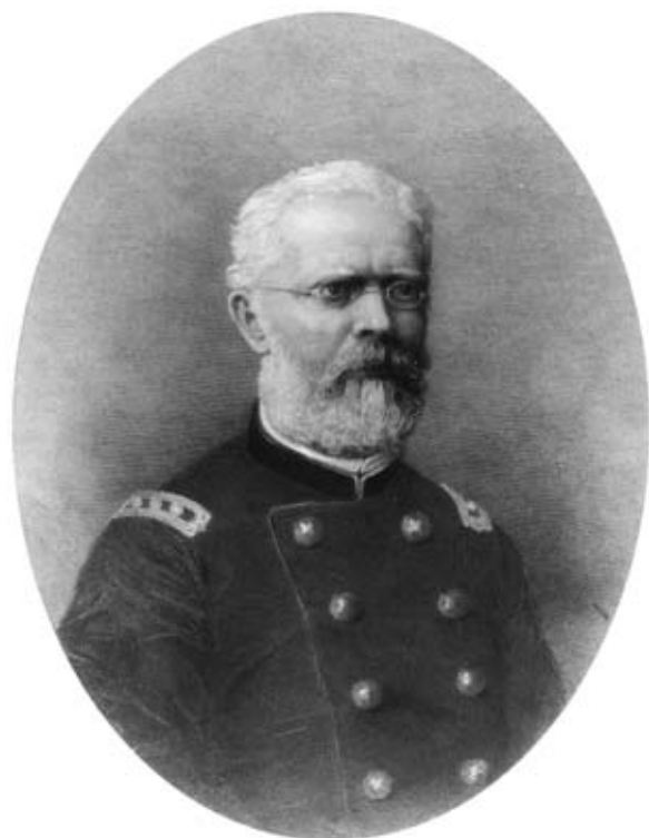
Oberst Hermann Siegfried (1819–1879), Leiter des Eidgenössischen Stabsbüro. Nach ihm wird die Topographische Karte der Schweiz auch als Siegfriedkarte bezeichnet.

Die meisten Bibliotheken in der Schweiz besitzen wie die StUB keine vollständigen Sammlungen sämtlicher Erstausgaben und Nachführungsstände der Siegfriedkarte. Von Mitgliedern der Arbeitsgruppe Kartenbibliothekarinnen/Kartenbibliothekare der Schweiz wurde seit längerem als notwendig erachtet, dieses immense Landschaftsgedächtnis der Schweiz auch in digitaler Form zugänglich zu machen. Die Digitalisierung der Siegfriedkarte wurde auch anlässlich der 9. Konferenz der Groupe des Cartothécaires de LIBER ange-regt, welche zum Thema «Kartenbibliothekswesen im Wandel» vom 26. bis 30. September 1994 an der ETH in Zürich und in der Landesbibliothek Glarus durchgeführt wurde. Zwar wurden in der Folge sämtliche Erstausgaben der Siegfriedkarte vom Bundesamt für Landestopografie (swisstopo) eingescannt. Diese Arbeiten mündeten jedoch noch nicht in das von den Bibliotheken gewünschte Produkt. Aufgrund der Projektidee «Digitalisierung der Siegfriedkarte» vom 18. April 2002 wurden Vergleichsofferten bei swisstopo sowie einem weiteren Anbieter eingeholt. Anschliessend wurden Testdatensätze begutachtet und technische Fragen geklärt. Der Auftrag konnte Ende 2002 schliesslich swisstopo erteilt werden, wobei ein Konsortium von Bibliotheken gebildet wurde, die sich am Kauf der Daten der digitalen Bibliotheksausgabe beteiligten. Mit jeder dieser Bibliotheken schloss swisstopo einen entsprechenden Vertrag als Partner des Projekts «Siegfriedkarte digital» ab. Es wurde eine Bildauflösung von