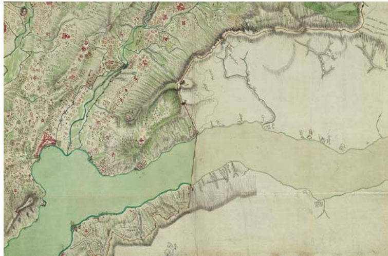
Abb.5: Neurone, Pietro: Karte des Sottoceneri 1780 (Ausschnitt Lugano und Umgebung)