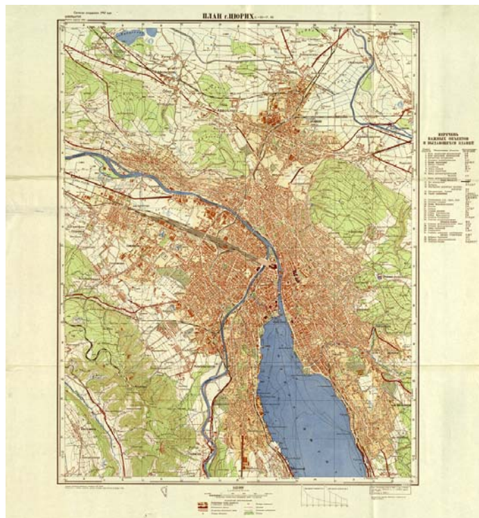
Abb.7: Russischer Stadtplan der Stadt Zürich 1:15 000. Moskau 1952

Neben diesen topographischen Kartenserien, die gewissermassen das Rückgrat der Kartensammlung bilden, finden sich in ihr Übersichtskarten der einzelnen Länder und ihrer Teilgebiete, Stadtpläne und in beschränkter Masse auch thematische Karten, die vornehmlich über Geschichte, Ethnographie, Sprachen, Wirtschaft und Verwaltungseinteilung orientieren. Auch geologische Karten sind wegen der Tauschverbindungen der Naturforschenden Gesellschaft in der ZBZ vorhanden, für die Schweiz ziemlich vollständig, für das Ausland nur zufällig für gewisse Länder.