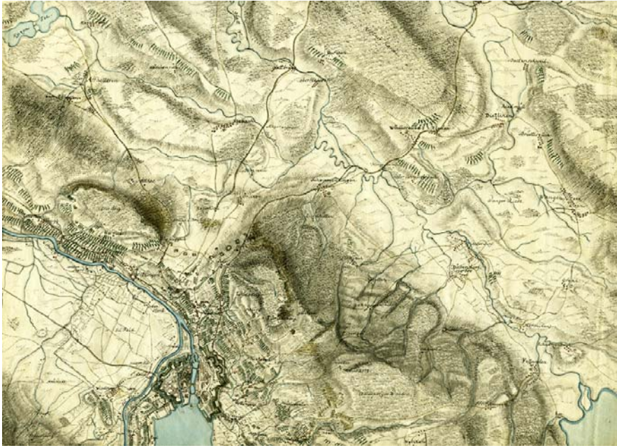
Abb.6: Usteri, Heinrich: Carte des Cantons Zürich nach der Geigerischen Carte gezeichnet nebst den Verschanzungen der Franzosen im Jahr 1799, 1:33 333. Gezeichnet 1802 (Ausschnitt)

Die Kartensammlung besitzt auch den Karten-Nachlass des Zürcher Kartographen und Panoramenzeichners Heinrich Keller (1778-1862). 43